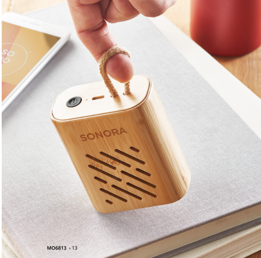
MO6813 › 13

Bezprzewodowe przenośne głośniki cieszą się coraz większą popularnością ze względu na ich kompaktową budowę i optymalną jakość dźwięku. Dostępnych jest wiele opcji różniących się pod względem stylu, materiału, mocy i przydatnych funkcji dodatkowych. Dźwięk głośnika o mocy 3W może w zadowalający sposób wypełnić średniej wielkości pomieszczenia. Potrzebujesz mocniejszego dźwięku? Wybierz głośnik o mocy 5W lub większej.