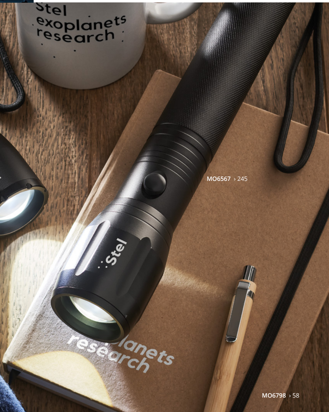
MO6567 > 245