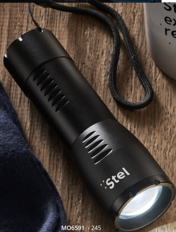
MO6591 > 245

Poręczne i lekkie latarki z możliwością regulacji wiązki światła. Dzięki mocy 200 lub 300 lumenów można oświetlić ścieżkę w ciemności. Idealne narzędzie do wykorzystania podczas samodzielnych prac domowych i w ciemnym otoczeniu .