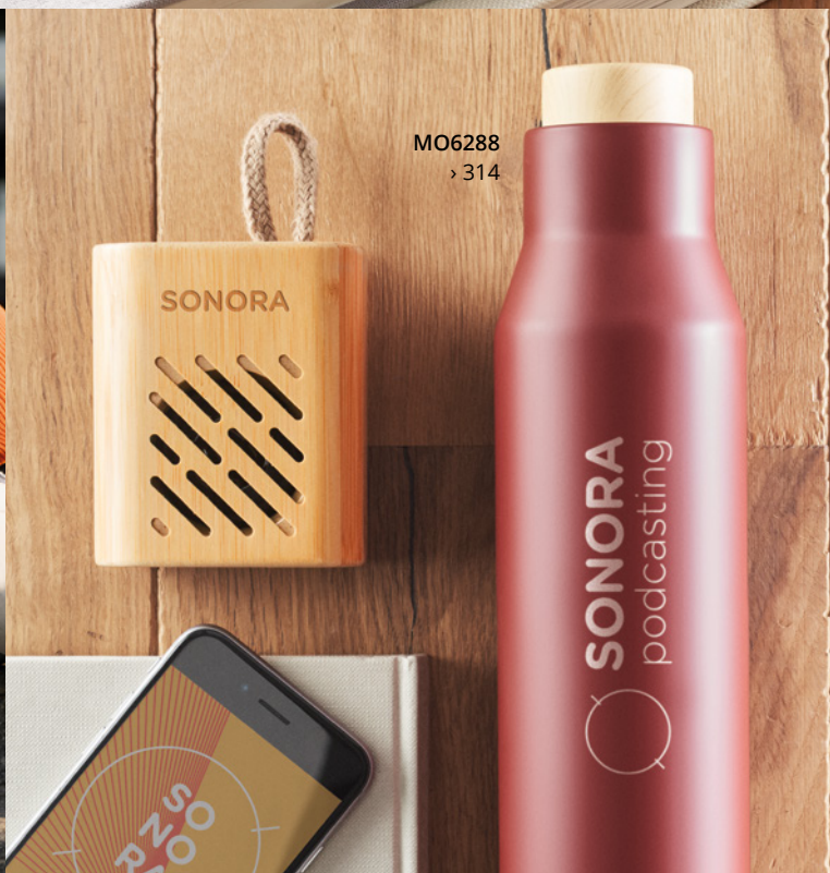
MO6288 › 314